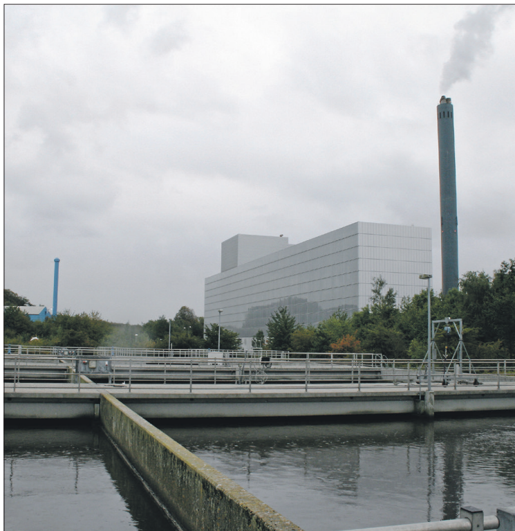
Rensningsanlægget og forbrændingsanlægget på Ydernæs udveksler energi.